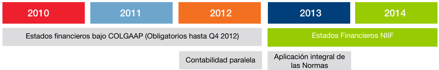
Ilustración Plan de Transición

La adopción de las normas es mucho más que una cuestión de números. Implica cambios que impactarán al negocio y su gente, sus procesos, sus sistemas de información, sus controles y gobernabilidad. Para lograr que la adopción sea un éxito, es necesario preparar su infraestructura y contar con las herramientas y conocimientos necesarios para identificar riesgos, amenazas y oportunidades relacionadas con este cambio. Neoris le puede ayudar. Contamos con amplia experiencia en este campo, tenemos un conocimiento profundo del impacto que las normas pueden tener en su ERP, y disponemos de las herramientas y recursos necesarios para facilitar la adopción de las normas.